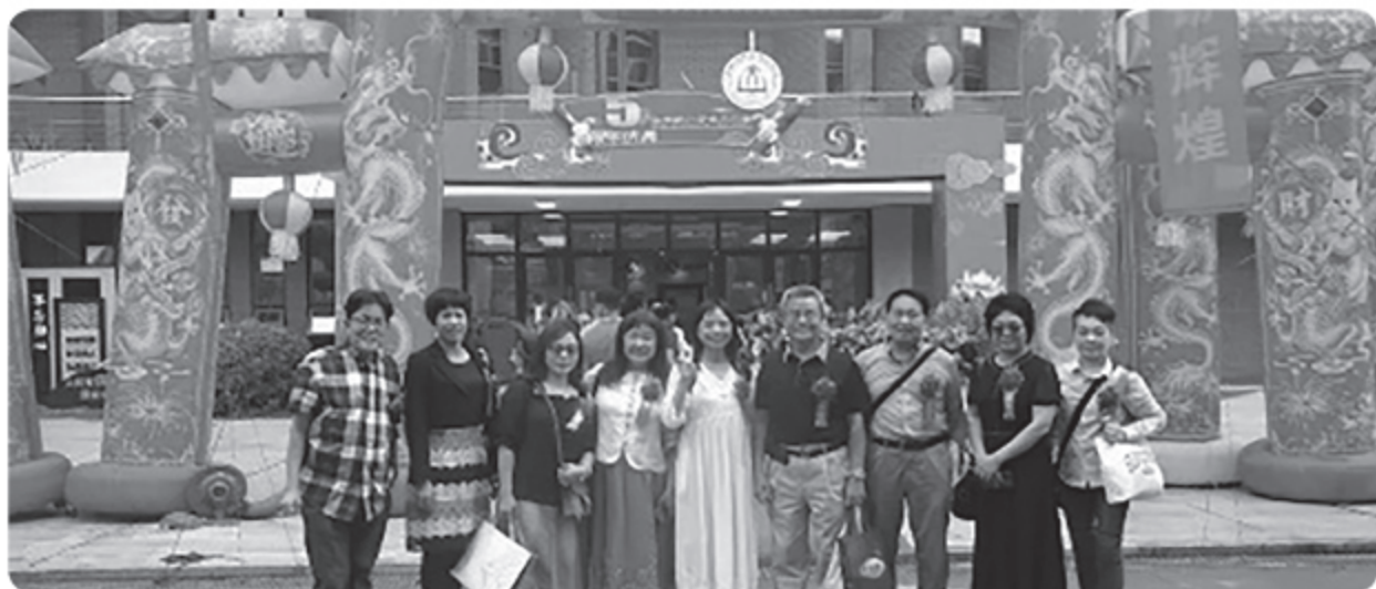
香港深圳慶賀團留影