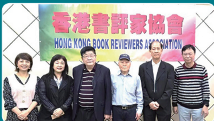
香港書評家協會正副會長合影