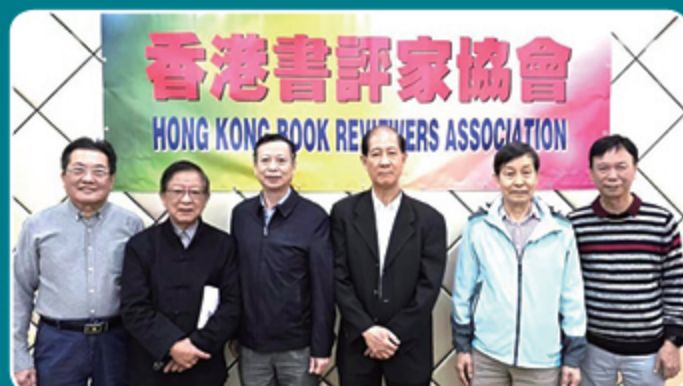
香港書評家協會的知青作家合影