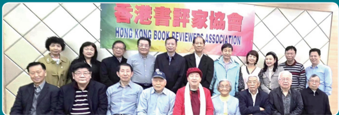
出席香港書評家協會2024龍年春茗的文學界朋友